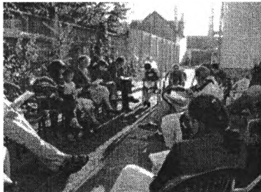
nyári találkozó a gyermekekkel és szüleikkel