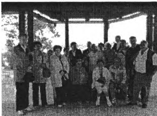
Koltó csoportkép a teraszon