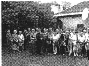
a nagybányai evangélikusokkal Radnai havasokban-Lóhavasi