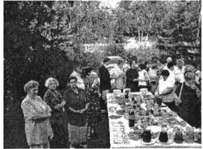
gyülekezetünk által rendezett vendéglátás